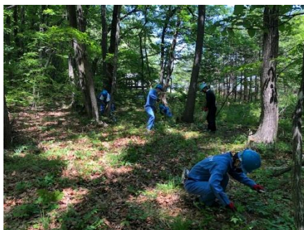
5月18日(水) ・丸太運び ・奥の森の下草刈り ・椎茸菌打ち