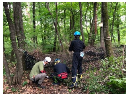
7月20日(水) ・北側エリアの下草狩り ・トトロの森ブッシュトンネルづくり ・ツタウルシの除去