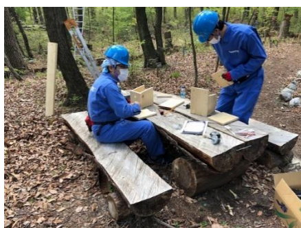
4月20日(水) ・小鳥の巣箱作りと設置

月に1回、サントリー白州工場から里山づくりのボランティアに来てくださっています。4月と5月と7月に開催しました。