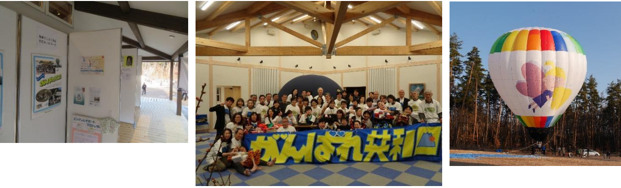
2019年のたくさんイベント時

協力:中村キース・ヘリング美術館、シミックホールディングス株式会社、株式会社リコペル、オーガニックライフ八ヶ岳株式会社