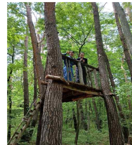
ツリーデッキからの眺めは最高!!

①個人が寄附した場合 当会に寄附をすると、国税と地方税をあわせて、寄付金額の最大50%が税額から控除されます。