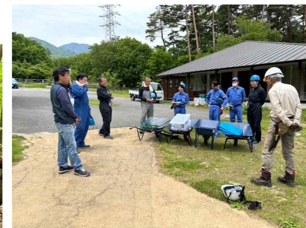
サントリー白州工場の皆様には、毎回大変お世話になっております。