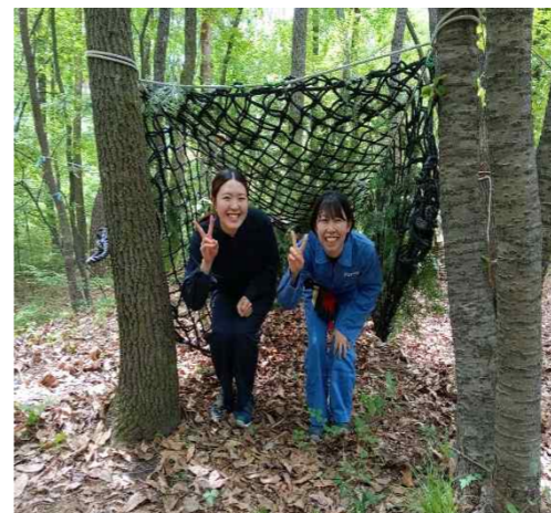
これから、トトロのトンネルを作ります！