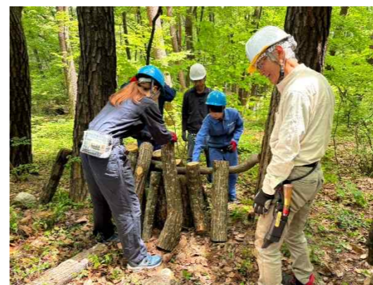
シイタケの栽培も！

③相続人等が相続財産権等を寄附した場合 相続又は遺贈により財産を取得した者が、その取得した財産を相続税の申告期限までに当会に対し、寄附した場合には、その寄附した財産の価値は相続又は遺贈に係る相続税の課税価格の計算の基礎に算入されます。